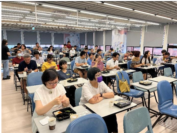
圖五、醫學院教師聆聽學務處報告